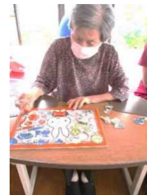
5階リハビリ室の様子