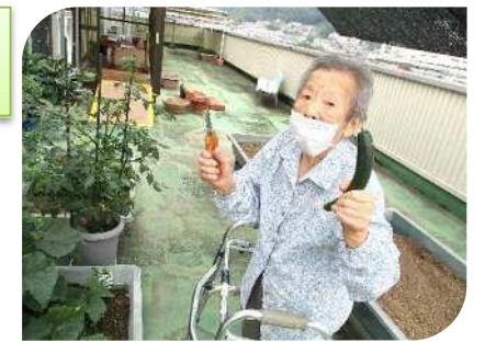
こんなに大きくなりました★★